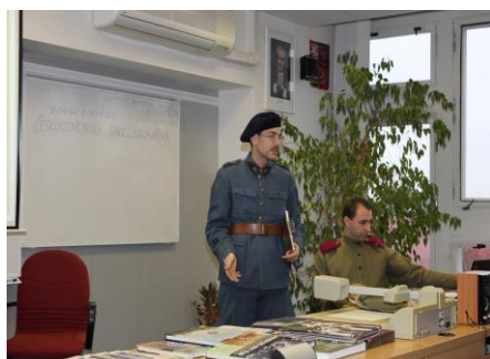
▲ Přednáška všechny velmi zaujala ▼ Přednášející představili žákům původní francouzskou a ruskou legionářskou uniformu