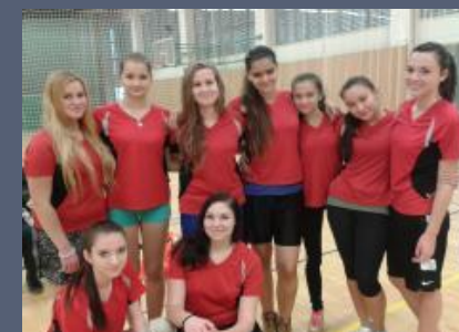
Text a foto družstva: Mgr. Libuše Mertlová Foto poháru: Mgr. Ladislava Mutinská

Naše děvčata obsadila ve velké konkurenci výborné 3. místo, ke kterému jim blahopřejeme!