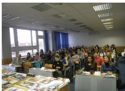
Přednášku se zájmem vyslechli nejen žáci, ale i pedagogové