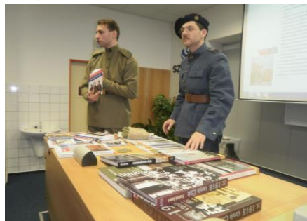
Žáci si prohlédli velké množství materiálů k tématu, některé si mohli odnést domů