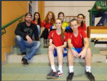
Naše děvčata na fotbalovém turnaji