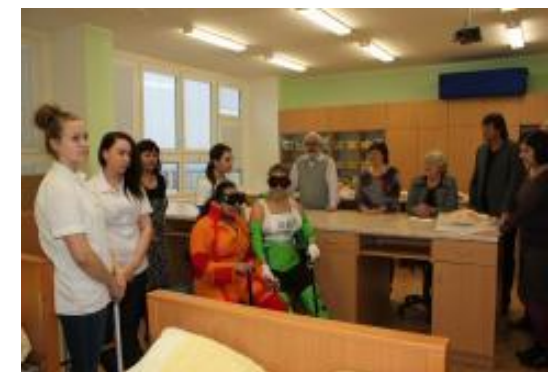
Žákyně třídy 2B ZA předvedly našim hostům edukační centrum Seniorů