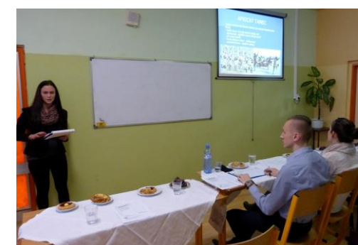
Text článku a foto: Mgr. Hana Štastná