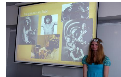
Jak byste si porozuměli s příslušníkem hnutí hippies? Odsoudili byste ho? Nebo by vám jeho názory byly sympatické?