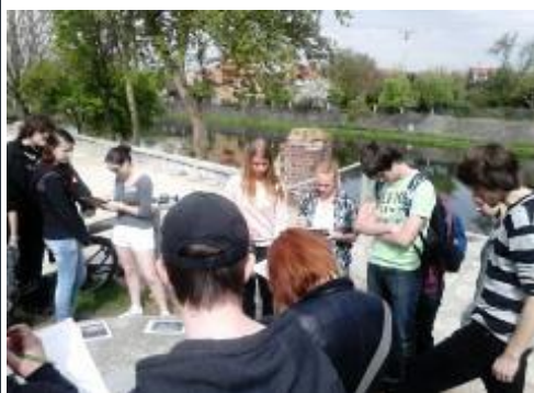
Výukový program Ekologického sdružení Ametyst „Na výpravě k plzeňským řekám“ absolvovala třída 1 ZDL. Trasa vedla od Mlýnské strouhy ke Kalikovskému mlýnu.