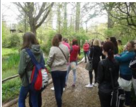
2B ZA navštívila ZOO Plzeň, kde absolvovala výukový program „Savci“