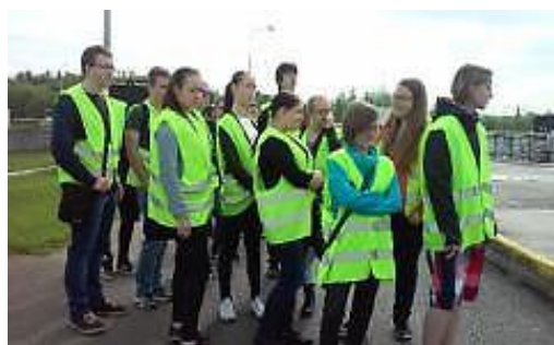
Třída 1 LAA se zúčastnila exkurze na čistítku odpadních vod v Plzni