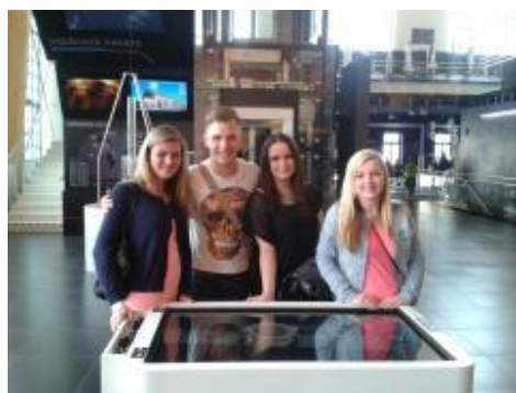
Třída 3B ZA navštívila Techmání