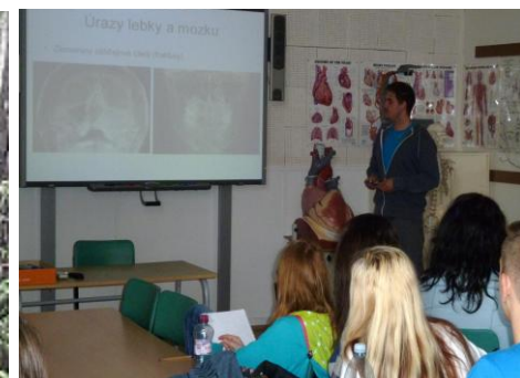
Přednášky na Fakultě zdravotnických studií ZČU na témata První pomoc, Bezpečný žák, Úrazy v RTG obrazech a Ochrana před zářením vyslechli žáci tříd 1B ZA, 2 ZDL, 3B ZA, 3 LAA, 1A ZA, 2A ZA a 2B ZA

Připravily: Mgr. Jaroslava Opatrná a Ing. Jaroslava Michálková