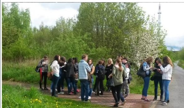
Žáci třídy 2A ZA podnikli dne 4.5. turistickou vycházku na vrch Sylván