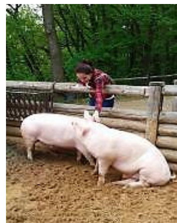
Výukového programu Savci v ZOO se zúčastnila rovněž třída 2 ZDL