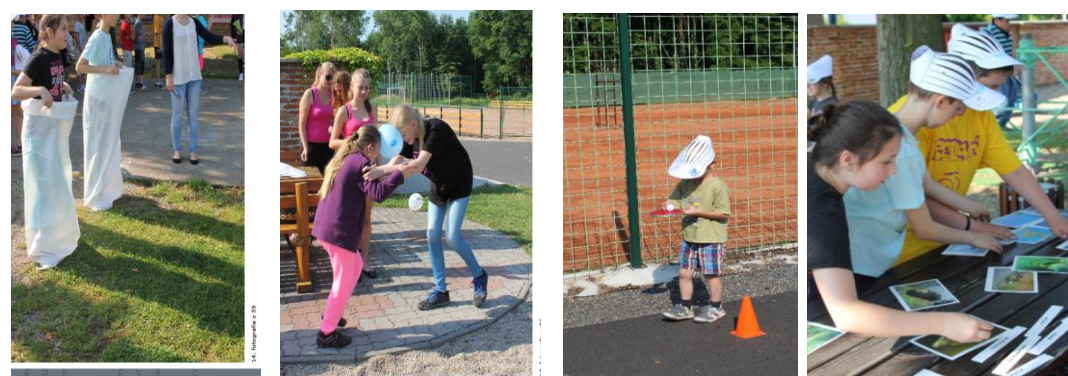
Skákání v pytli, přetlačování se s balónkem, slalom s pingpongovým míčkem, skládání obrázků – to jsou jen některé z mnoha zajímavých disciplín