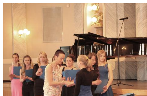
Svá maturitní vysvědčení převzali žáci tříd 4A ZA...