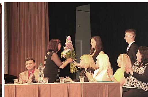
Žáci předali květinové dary s poděkováním nejdříve paní ředitelce, pak i ostatním