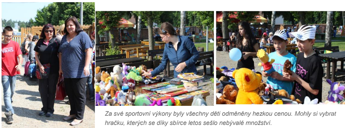
Za své sportovní výkony byly všechny děti odměněny hezkou cenou. Mohly si vybrat hračku, kterých se díky sbírce letos sešlo nebývalé množství.