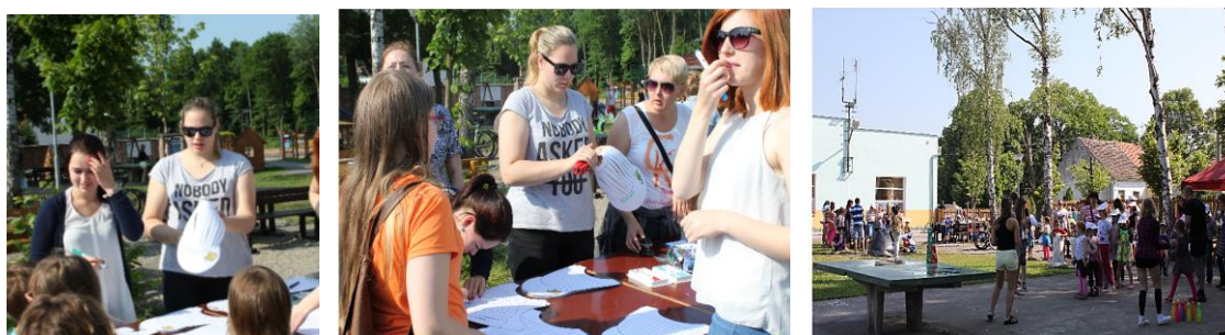
Při vstupu do areálu sportoviště dostali všichni účastníci dětského dne papírové čepice

Již tradiční akci si tentokrát vzali na starost žáci tříd 1A ZA a 1B ZA za pomoci 2A ZA a 2B ZA. Pro děti, kterých se v sokolovně na Nové Hospodě sešlo na dvě stě, připravili nezapomenutelné dopoledne.