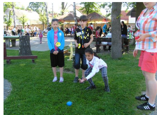
Ještě krátké zavzpomínání na Novou Hospodu 2014...