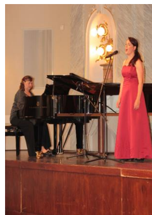
Vystoupení studentky PF bylo příjemným zpestřením programu