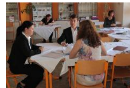
Součástí absolutoria je i zkouška z cizího jazyka