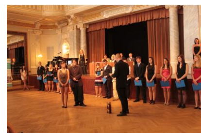
Slavnostní předávání maturitních vysvědčení, poděkování třídním učitelům – a pak už hurá do života!