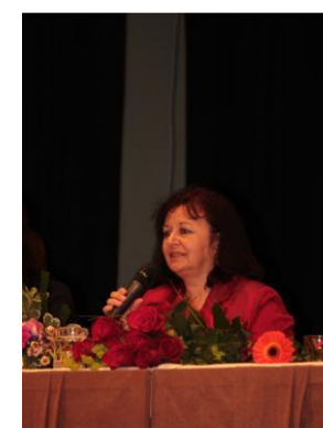
Projev paní ředitelky na slavnostním vyřazení