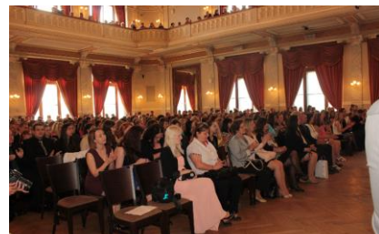
Publikum tvořili naši žáci a rodiče abiturientů