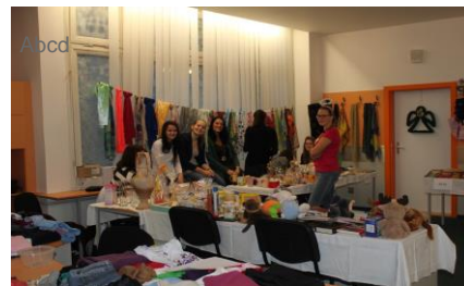
Příprava bazaru byla velmi náročná. Pomáhali žáci tříd 3B ZA, 4A ZA i studenti všech oborů VOŠ

Výtěžek – v letošním roce rekordních 16.886 Kč – bude poukázán charitativní nadaci Ženy a dívky v tísní, Plzeň, Husova ul.