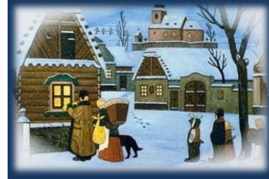
Připravila: Slávka Michálková