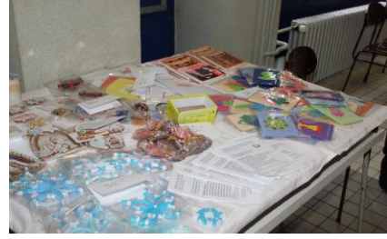
Prodávala se také vánoční přáníčka, papírové ozdoby a další výrobky tvůrčí dílny nadace Ženy a dívky v tísní