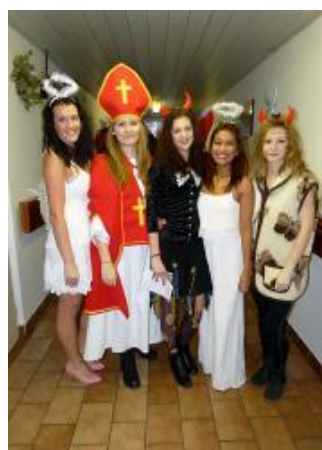
Naši žáci – Mikuláši, andělé a čerti jako z pohádky