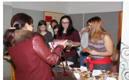
O nabízené předměty byl nebyvalý zájem