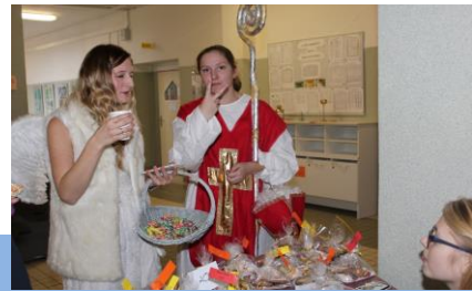
Co by to bylo za mikulášský bazar, kdyby na něm chyběl Mikuláš? Jeho účast zajistily dívky ze 4A ZA. Přišel s cháskou nebeskou i pekelnou a jak je vidět, s průběhem akce byl spokojen.