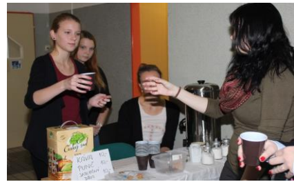
Nejrychleji se prodalo občerstvení – kolegyně a studenti napekli a darovali spousty dobrot, jejichž prodejní výtěžek byl součástí výsledné částky