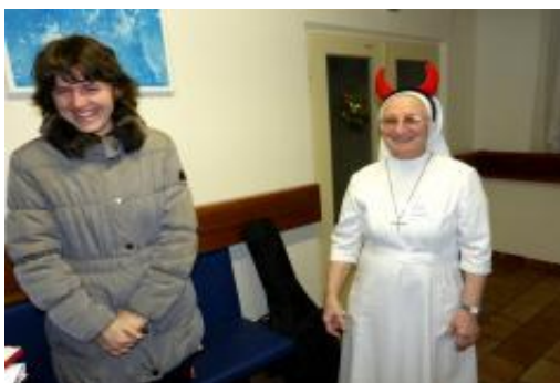
▲ Mikulášská nadílka plná emocí – úsměvy střídaly slzy dojetí