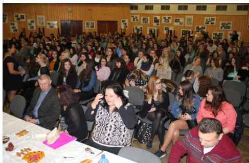
Kulturní sál dopravní průmyslovky byl již před devátou hodinou zaplněn žáky školy. Svá místa zaujali rovněž hosté, vedení školy i pedagogové