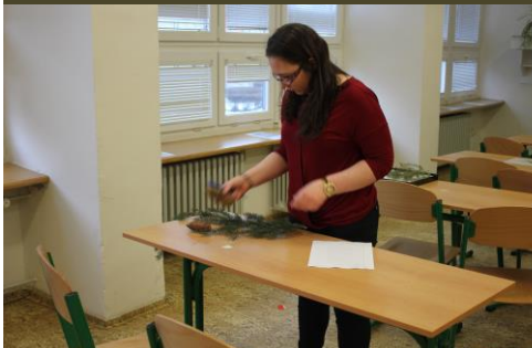
„Poznávka“ rostlin – je to opravdu ten smrk?