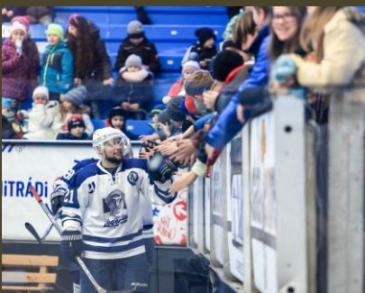
Akademici se svými fanoušky