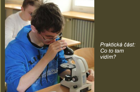
Praktická část: Co to tam vidím?

Text článku: Mgr. Jaroslava Opatrná