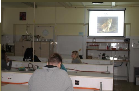
„Poznávka“ živočichů – vždyť to je rys ostrovid!