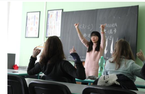
Netradiční výuka – nejen angličtina, ale i čínština