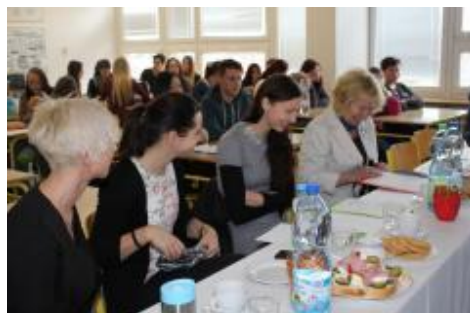
Porota měla nelehký úkol – vybrat z mnoha výborných prací ty nejlepší