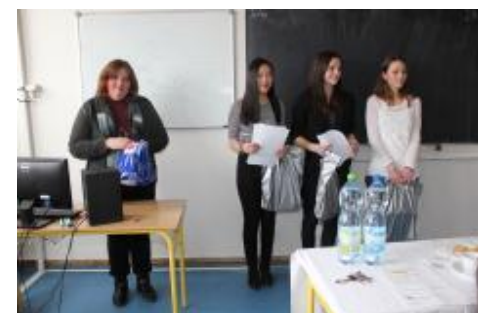
Vítězky školního kola obdržely za svůj výkon nejen diplomy, ale i drobné dárkové předměty