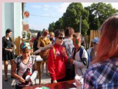
▲ Již dlouho před devátou hodinou bylo u vchodu do sokolovny velmi živo a naše žákyně měly plné ruce práce, aby všem dětem daly medaile a karnevalové škrabošky ◀ Maskot karnevalu – klaun Francesco