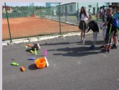
Skákání v pytích, srážení plechovek nebo kuželek, malování, cvičení, přenášení míčku na lžičce – to jsou jen některé z mnoha disciplín, které si naši žáci pro děti připravili