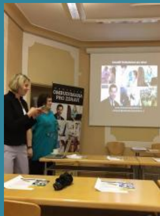
Zaměstnanci Kanceláře ombudsmana vysvětlují zájemcům na modelových situacích práva pacientů