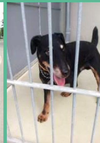
Tak aby už ty smutné psí oči nebyly tolik smutné...

Připravily: Mgr. Jaroslava Opatrná a Ing. Jaroslava Michálková