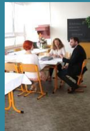
Z absolutoria u oboru Diplomovaný zdravotní laborant a Diplomovaný zdravotnický záchranář