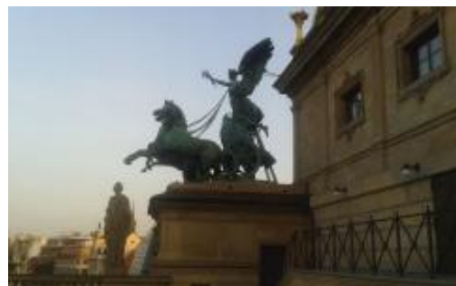
▲ Na střeše Národního