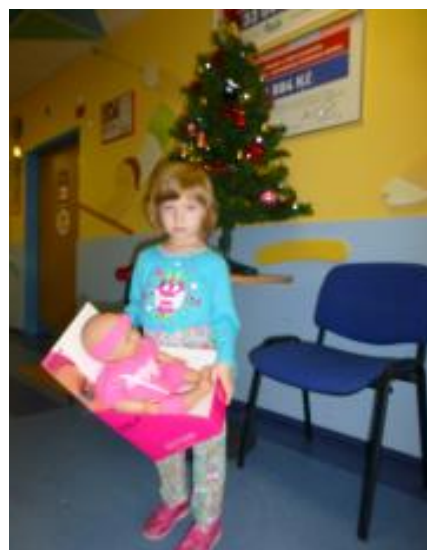
(Máme svolení, že můžeme fotografie publikovat)