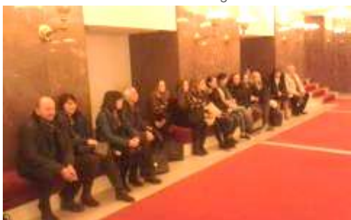
Ve foyer Divadla na Vinohradech