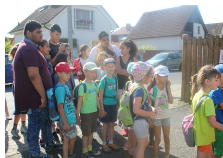
Již před devátou hodinou bylo u vchodu do sokolovny na Nové Hospodě velmi živo