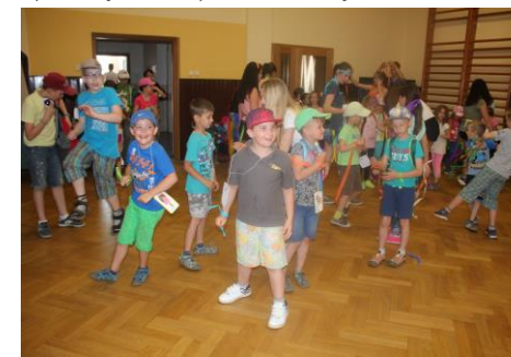
Dlouhatánský „had“ dovedl děti do tělocvičny na diskotéku, kterou si bezvadně užili menší i větší