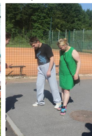
A pak se již všichni rozběhli plnit jednotlivé (mnohdy nelehké) soutěžní úkoly