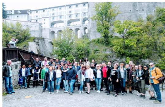
V Českém Krumlově

Krásné (nikoli rozmarné) léto a příjemné prožití dovolených Vám všem přeji a na Vaše příspěvky do Minialma- nachu se v příštím školním roce těší