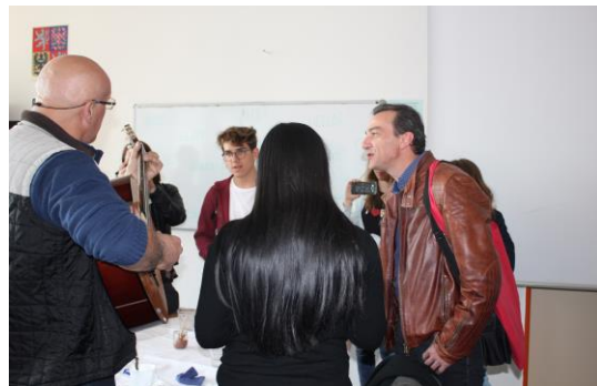
O přestávce kromě výborného občerstvení došlo i na zpěv