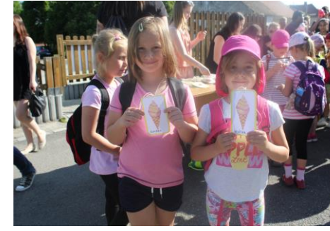
Jako každoročně dostaly všechny děti medaile, tentokrát s motivy sladkostí, neboť téma letošního dětského dne bylo V cukrárně