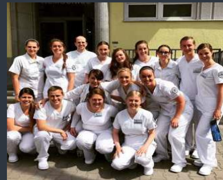
Na stáži v Mulačově nemocnici – společné foto před nemocnicí