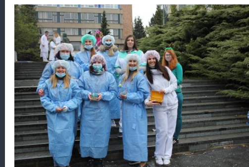
Závěr středoškolského studia musí být pořádně viditelný i slyšitelný – takhle vypadali při posledním zvonění žáci 4 LAA a 4B ZA