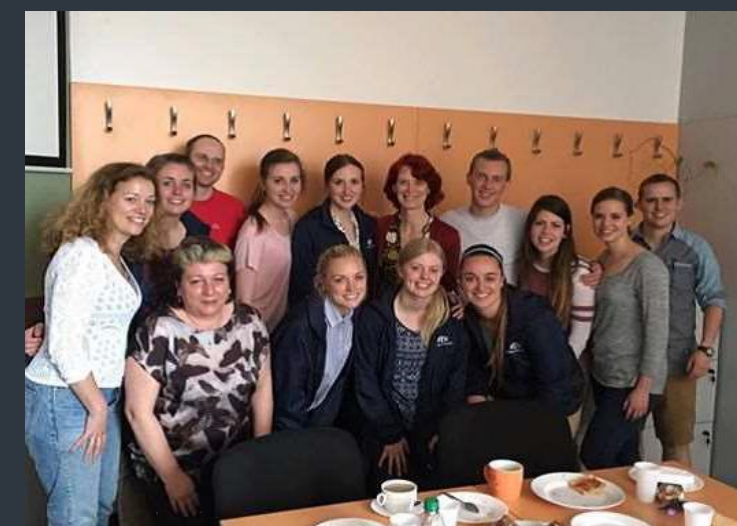
Závěrečné setkání ve škole