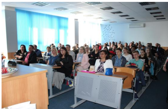
Zahájení celé akce dne 10. 5. v učebně 217

Tým učitelů a žáků SZŠ a VOŠZ Plzeň představil svým protějškům z Turecka, Polska, Slovinska, Portugalska a Itálie v květnových dnech nejenom památku UNESCO v České republice. Mezinárodní týmy navštívily Plzeň, Mariánské Lázně, Karlovy Vary, Prahu, Holašovice a Český Krumlov. Součástí pracovního programu bylo také představení plzeňské hostitelské školy a milé přijetí na Krajském úřadě Plzeňského kraje. Mgr. Jan Malata