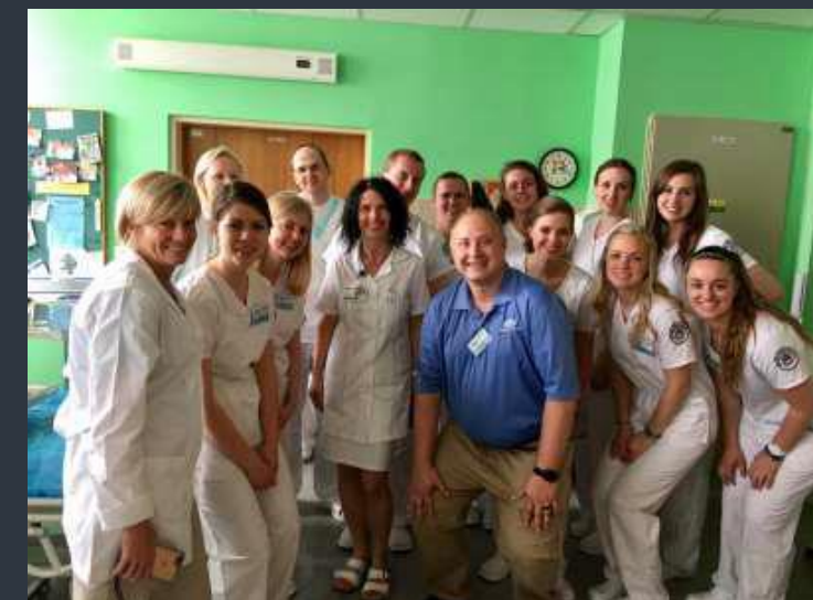
Na Dětské klinice FN Plzeň