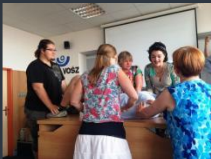
Názorná ukázka nevhodného přístupu personálu k dětskému pacientovi (násilné znehybnění, „restraint“).