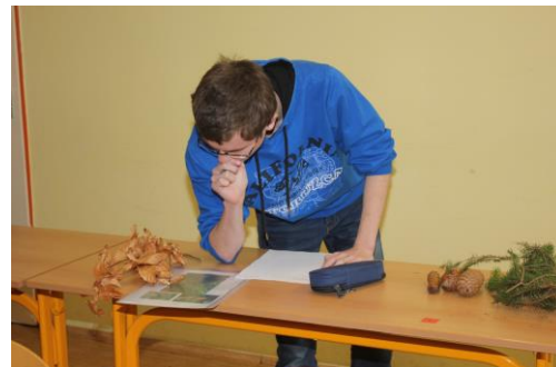
„Poznávačka“ dala většině žáků docela zabrat