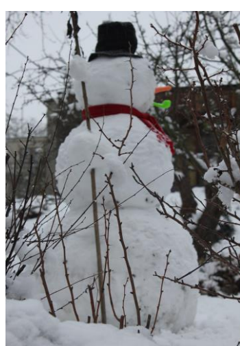
Bez sněhuláka by to nebyla žádná zima