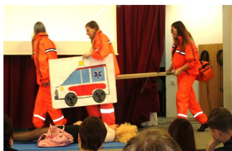
Děvčata ze 3A ZA a jejich velice zdařilá scénka „Sanitka“