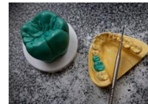
Modelace z vosku