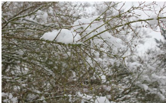
Zima, jak se patří