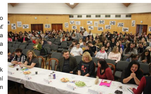
Zcela zaplněný sál SPŠ dopravní

O tom, jak se na otázku zdraví či nemoci dívají naši žáci, jak vnímají nemoc jiné národnosti nebo jaký je psychosociální přístup k léčbě, byl právě letošní projektový den. Tradičním místem konání se opět stal přednáškový sál vedlejší školy dopravní, který je schopen pojmout hojnou účast našeho obcenstva i pozvaných hostů