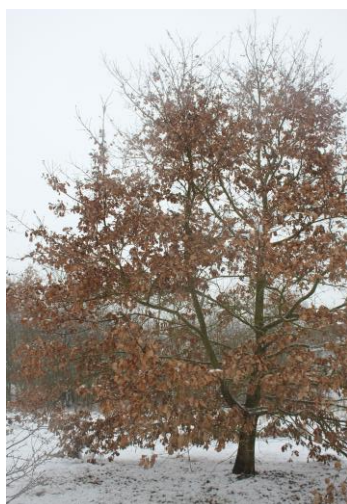
Kdy opadá listí z dubu?