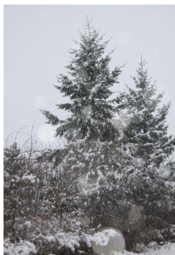
Sníh všude, kam se podíváš