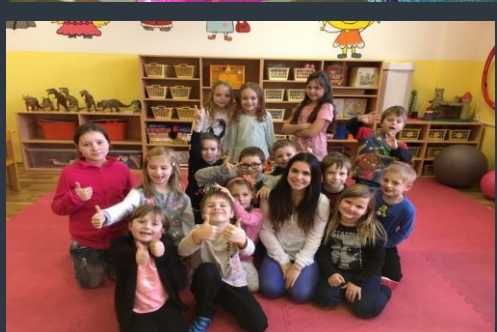
Text a foto: studenti oboru DNT