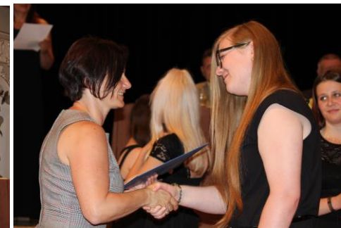
Svá maturitní vysvědčení převzali žáci 4A ZA...