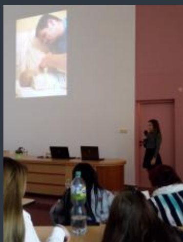
Eliščina přednáška – bohužel se v soutěži objevila další dvě velmi podobná témata