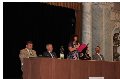
Vedení škol a hosté slavnostního vyřazení

Text článku: PhDr. Ilona Gruberová, PhD.