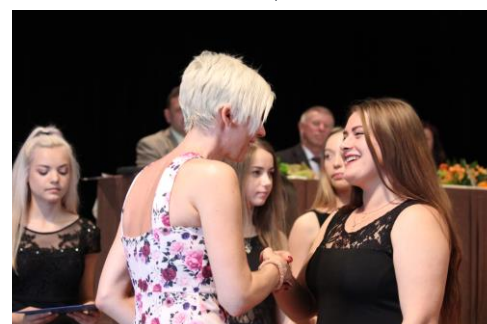
... 4 LAA...