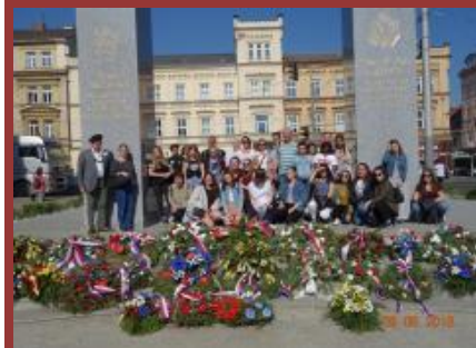
Pomník Americké armádě v Plzni