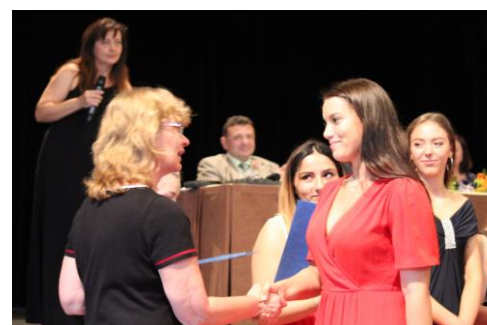
... 4B ZA...