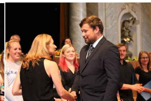
... 4 ZDL...