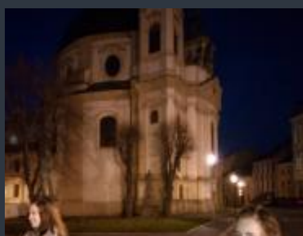
Noční prohlídka Kroměříže

Nevadí – i přesto Eliška naši školu vzorně reprezentovala, za což jí velmi děkujeme.