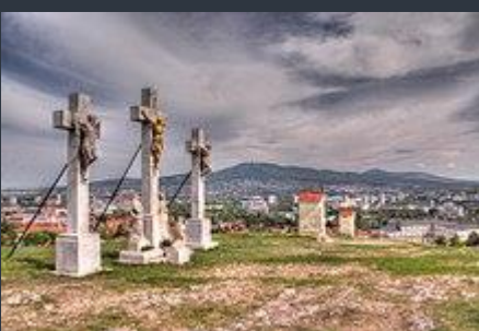
Vrch Kalvárie v Nitře

Text článku: Mgr. Jaroslava Opatrná