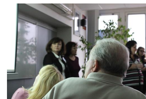
Učebna 219 byla zaplněna do posledního místečka

O tom, že se Den otevřených dveří vydařil a že je o naši školu zájem, svědčí především počet návštěvníků – ten byl v letošním roce rekordně vysoký.