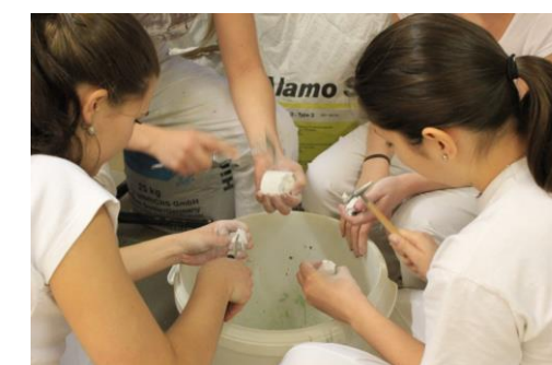
Asistenty zubního technika zastihli návštěvníci v pilné práci

Další fotografie ze Dne otevřených dveří najdete na T:\fotky\2014\doď