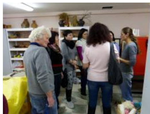
V článku použito materiálů a fotografií kolegyně Mgr. Hanky Šťastné