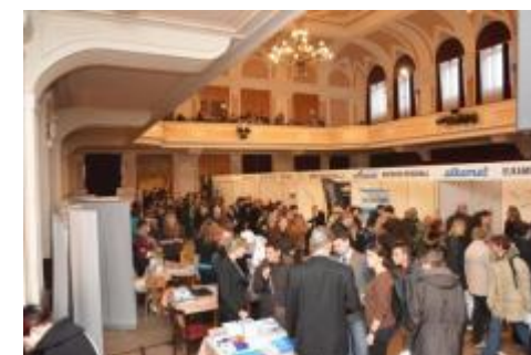
V článku použito materiálů a fotografií kolegyně Mgr. Radky Polívkové