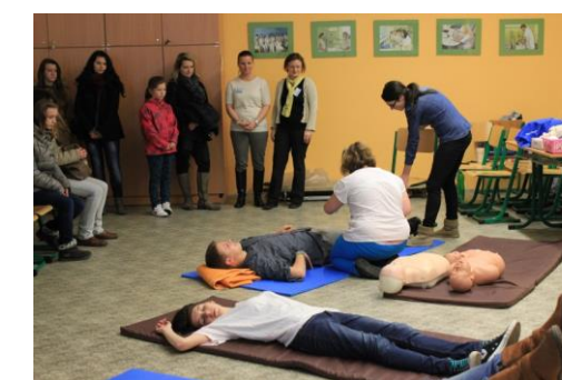
Velmi působivé byly ukázky první pomoci v provedení našich žáků