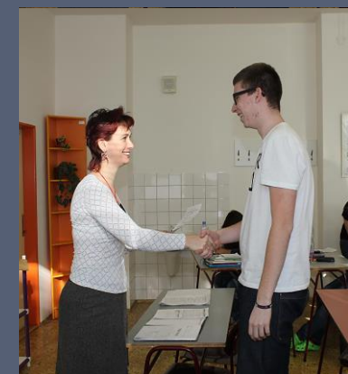
Čtvrtáci převzali své poslední pololetní vysvědčení. Druhé pololetí uteče jako voda – a už se mohou těšit na vysvědčení maturitní.