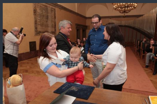
Foto z vítání občánků na plzeňské radnici dne 28.3.2014