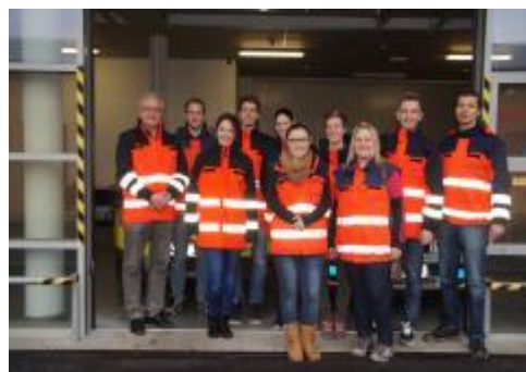
Naši a němečtí studenti na návštěvě Záchrané služby Plzeň