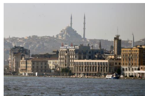
Istanbul – město jak z pohádek tisíce a jedné noci