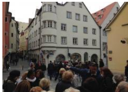
▲ V centru Regensburgu