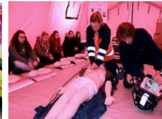
Návuk základní neodkladné resuscitace