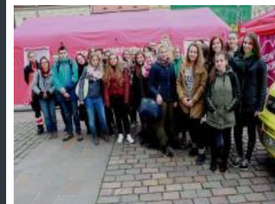
Žáci před červeným stanem na náměstí Republiky