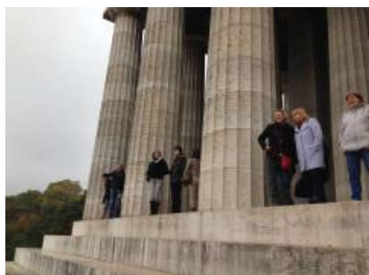
▲ Majestátní sloupové v průčelí Wallhally