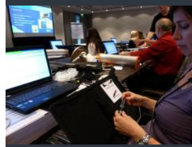
V článku bylo použito materiálů a fotografií Mgr. Hany Šťastné