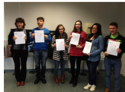
◀ Všichni účastníci akce obdrželi certifikát o účasti