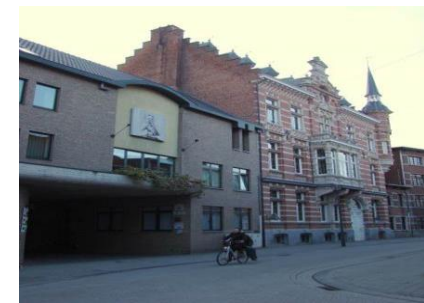
▲ Město Turnhout – střední škola HIVSET