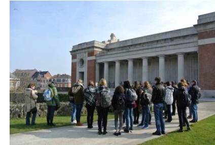
▼ Flanders Fields Museum v Ypres