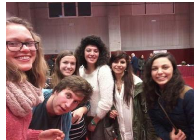
Den jsme zakončili uvítací oslavou, kterou pro nás připravila partnerská italská škola. Oslava sloužila především k tomu, aby se studenti různých škol mezi sebou poznali