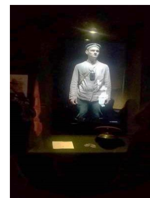
▲ Z expozice muzea v Ypres