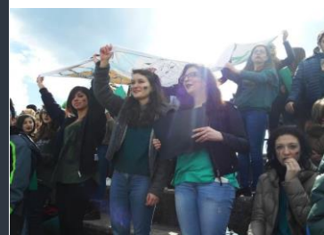
▼► Po zápase bylo nachystáno pohoštění ve škole. Byl připraven i speciální ERASMUS+ dort.