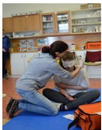
A pak záleželo již na šikovnosti a znalostech každého z týmů...