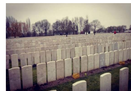
▲ ▼ Vojenské hřbitovy z 1. světové války