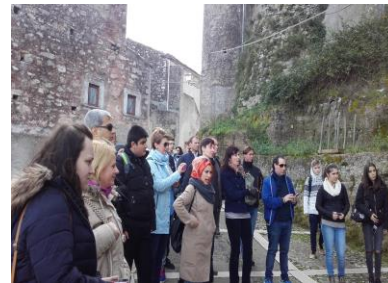
Projekt samotný jsme začali exkurzí ve městě Vico del Gargano vedenou italským průvodcem.

Program byl velmi nabitý a tak jsme se ani trochu nenudili. Jelikož projekt Erasmus + spolupracuje i s dalšími evropskými státy, naší další zastávkou bude Polsko na které se všichni už moc těšíme.