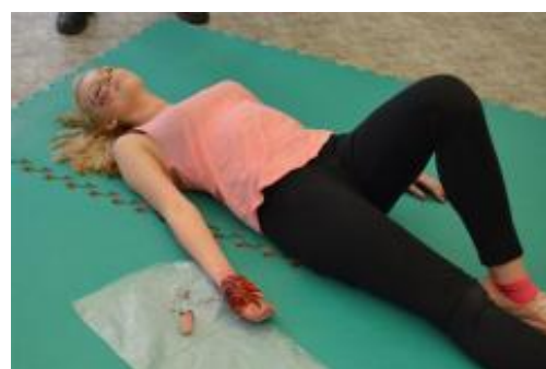
K tomu, aby se soutěž co nejvíce přiblížila realitě, přispěli též namaskovaní figuranti