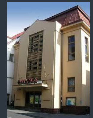
Divadlo v Klatovech – dějiště krajského kola recitační soutěže