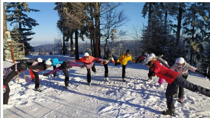
Rozcvička – celé družstvo holubiček

Bylo dostatek času rovněž na různé sportovní a společenské hry. Protože i počasí lyžařům přálo, užili si naši žáci krásný a určitě nezapomenutelný týden na Šumavě.