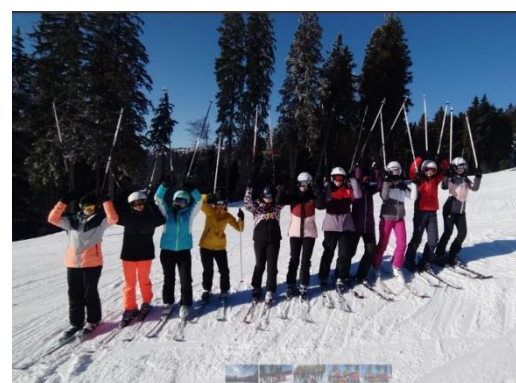
Jdeme na to!