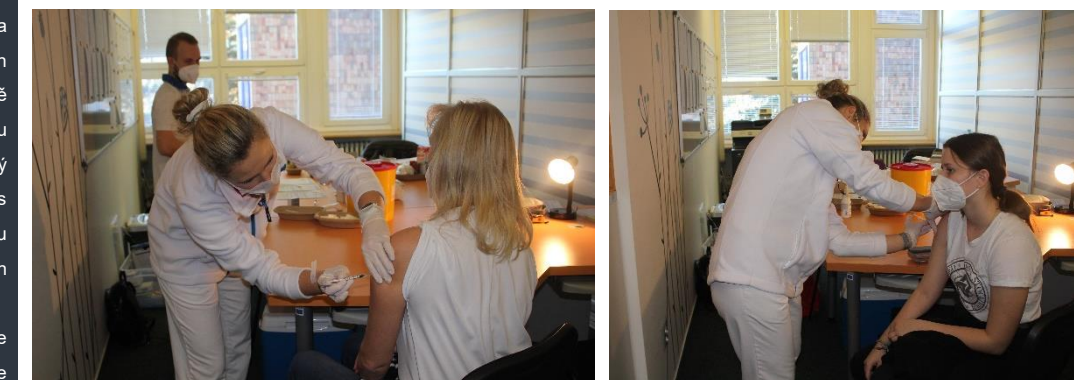
Důležitost očkování si plně uvědomují nejen naši zaměstnanci, ale i žáci a studenti