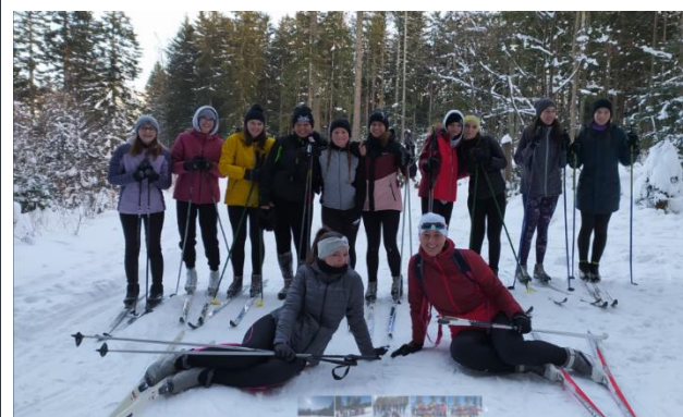
Krátké zastavení lyžařů – běžců