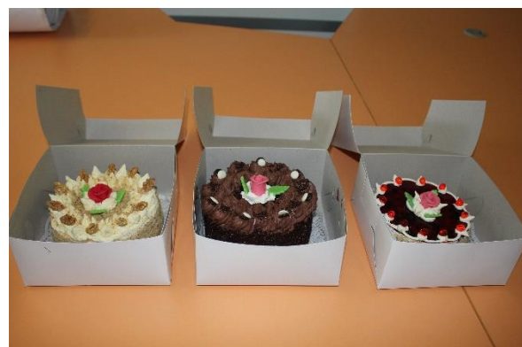
Vyhodnocení soutěže proběhlo dne 3. března ve sborovně školy. Sladké odměny vítězkám předal zástupce ředitelky školy RNDr. Milan Štěpánek