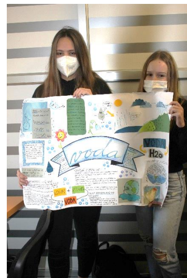
Tři nejlepší týmy se pochlubily svými plakáty