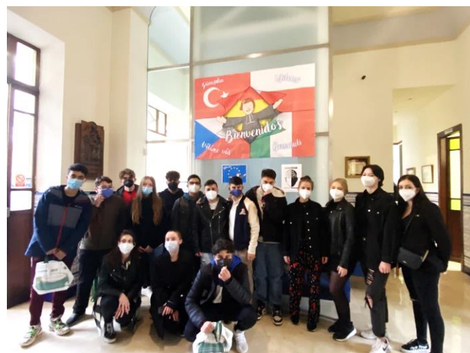
Připravila: Mgr. Nina Ščerbová