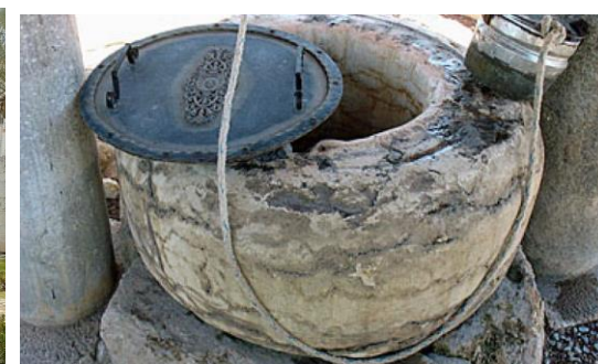
Dalším slavným rodákem byl jistý Šavel – později svatý Pavel z Tarsu. Na obrázku je studna na dvoře Pavlova rodného domu