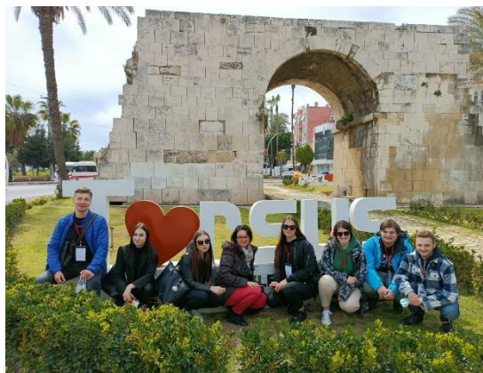
Naše skvělá skupina před Kleopatřinou bránou v Tarsu – na tomto místě se prý kdysi poprvé potkali Marcus Antonius s Kleopatrou