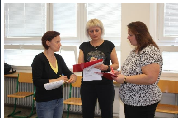
Soutěžní komise stála před nelehkým úkolem – vybrat tři nejlepší týmy