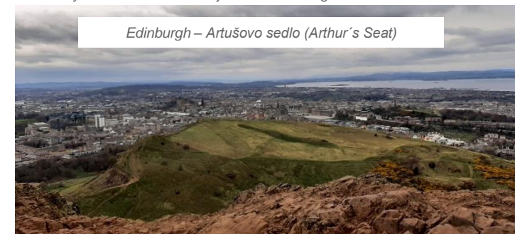
Edinburgh – Arthuovo sedlo (Arthur's Seat)

Vzdělávání ve Skotsku je na vysoké úrovni. V roce 2014 bylo Skotsko vyhlášeno nejvzdělanější zemí v Evropě. Veřejné školy jsou spravovány místními komunitami. Povinné vzdělávání zahrnuje základní a střední školy. Vzdělávání na soukromých školách a na univerzitách je zpoplatněno. Největší zastoupení soukromých škol ve Skotsku najdeme v Edinburghu.