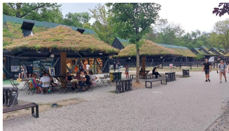
Zelené střechy na veřejných budovách pomáhají snižovat teplotu uvnitř budov. V Polsku se dnes stávají samozřejmostí.

V rámci projektu Green Art, Green Sport for the Green Europe jsme ve dnech 19.-25. července 2022 jsme se zúčastnili mezinárodního setkání pracovních skupin v polské Lodži. Druhé největší město Polska na nás zapůsobilo nejen svou rozlohou, ale především jako zelené město, plné parků, místy až velmi drsně přirozené, které se snaží se zachovat si svůj historicky-industriální ráz.