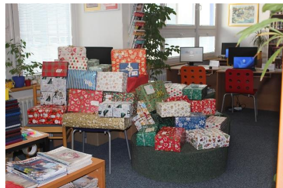
Krabice rychle přibývaly – vlevo situace z 1. 12., vpravo 2. 12.