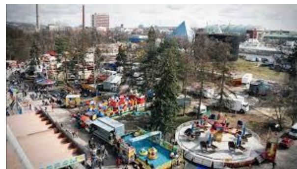
Dnešní matějská pouť už ničím nepřipomíná původní výroční poutní slavnost u kostela sv. Matěje

Na základě různých zdrojů připravila Ing. Jaroslava Michálková