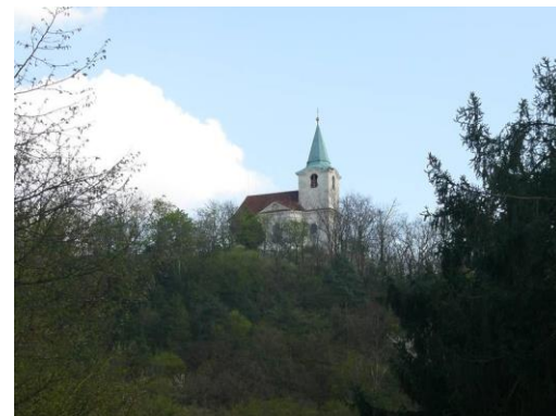
Současná podoba kostela sv. Matěje v Dejvicích

Kostel byl údajně vysvěcen sv. Vojtěchem. V roce 1170 byl z důvodu nedostatečné kapacity zbořen a nahrazen novou stavbou. Matějská pouť postupně pozbývala na tradičním charakteru a proměnila se v lidovou veselici, které se účastnily davy lidí. Od roku 1963 se pořádá na Výstavišti v Holešovicích.