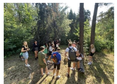
Žáci 2 ZDL a 3 BPS absolvovali výukový program v arboretu Sofronka